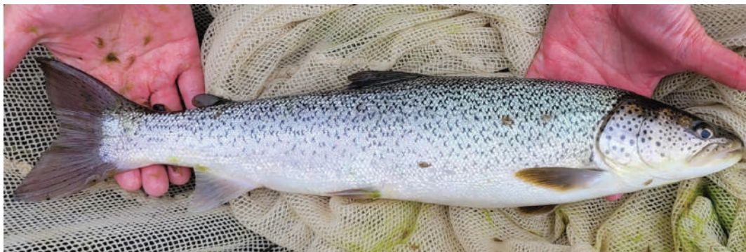
Рис. 1. Сахалинский таймень из оз. Лебединого (о. Итуруп)

Сахалинский таймень Parahucho perryi (рис. 1) — весьма противоречивый объект для исследования. С одной стороны, этот вид занимает сравнительно небольшой ареал, характеризуется невысокой численностью и на большей части ареала не является объектом вылова. Однако с другой стороны, таймень — это крупный лосось и даже при небольшой численности является заметным элементом прибрежных и пресноводных биологических сообществ, а также хорошо известным элементом ихтиоцены для жителей дальневосточных регионов, причем как связанных, так и не связанных с рыбным промыслом и любительским рыболовством. Более того, благодаря работе природоохранных организаций и ихтиологов-энтузиастов сахалинский таймень постепенно приобретает статус вида, на примере которого можно воспитывать людей в духе ответственного отношения к окружающей среде и сохранения биологического разнообразия [Макеев и др., 2014; Макеев, 2023].