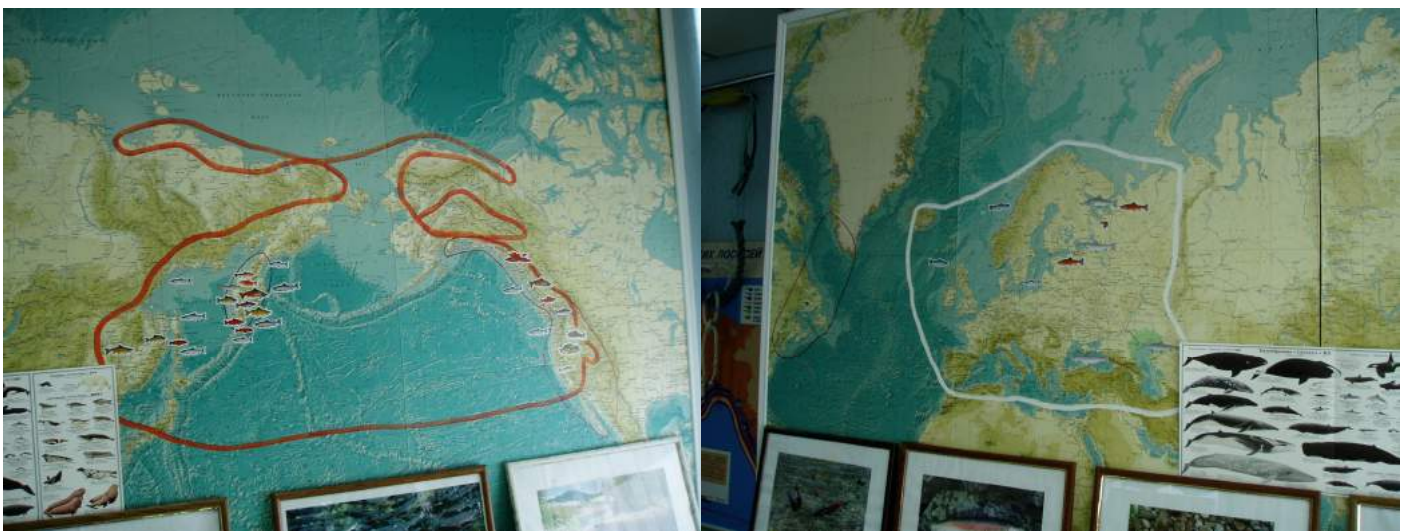
Еще одна карта Северного полушария с ареалами тихоокеанских и атлантических лососей. Не видно различий в жизненных циклах этих родов.