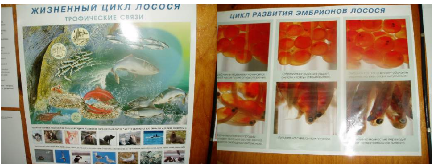
Жизненный цикл нерки приводится рядом со списком потребителей лосося. Плакатик с эмбрионально-личиночным развитием.