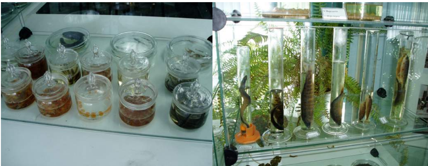
Разные влажные препараты.