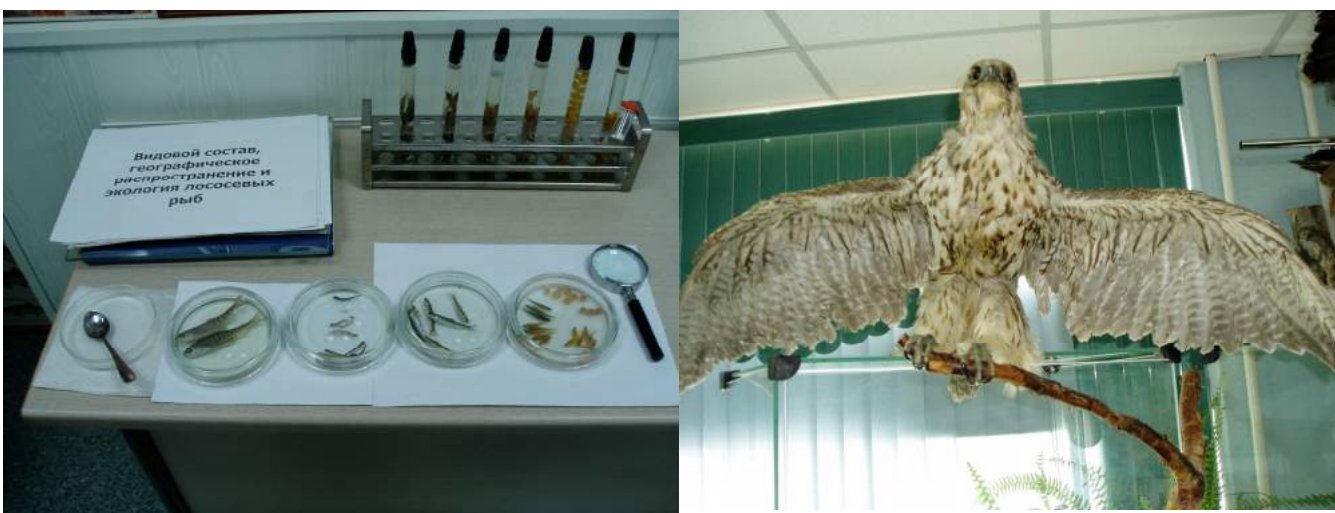
И разные представители камчатских экосистем.