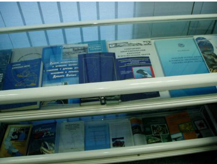
Еще элементы экспозиций музея.