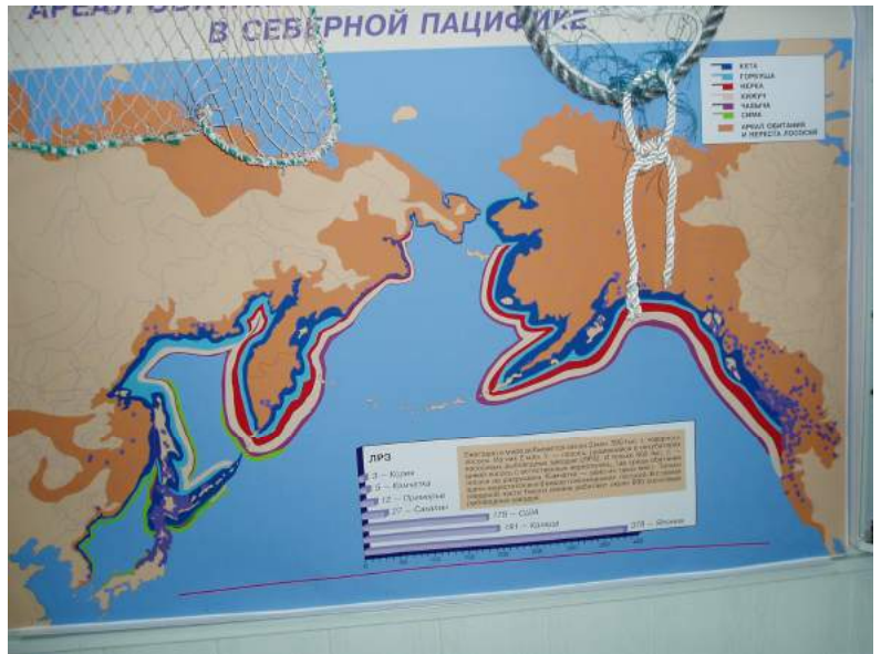
Теперь о содержании музея и переносных выставок Видовой состав рода Oncorhynchus и других лососевых Камчатки. Карта ареалов с количеством ЛРЗ.