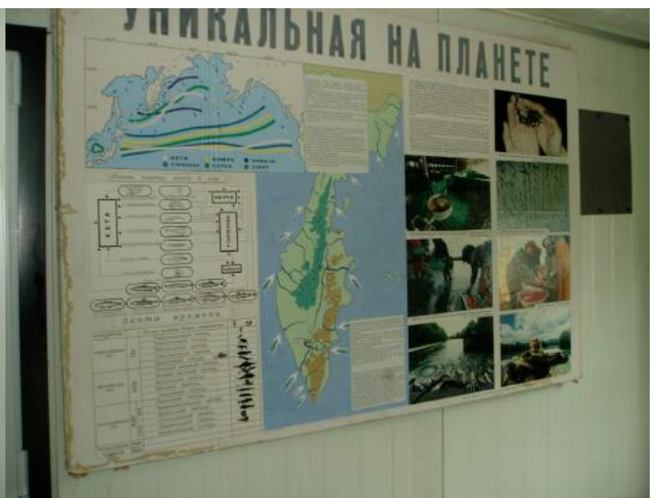
И оформление офиса Малкинского рыбноводного завода. Ничего не напоминает?