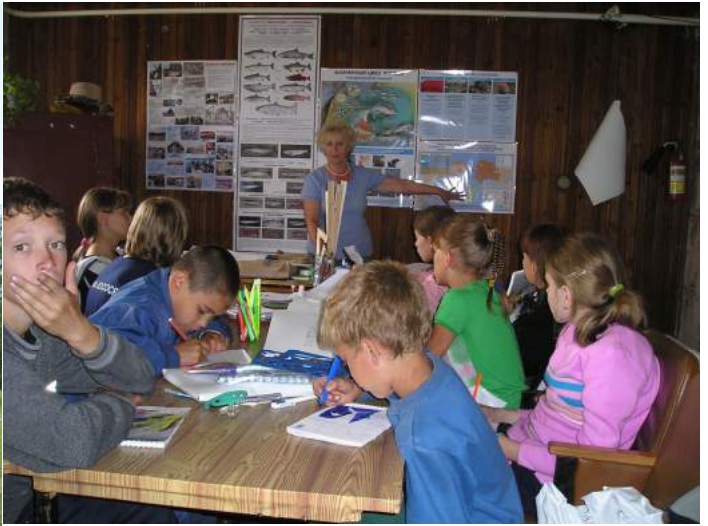
Еще одна форма работы на Камчатке - этно-экологический детский лагерь.